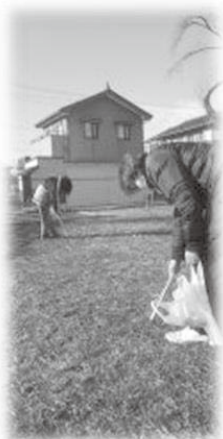
市内公園の遊具チェックやゴミ拾い